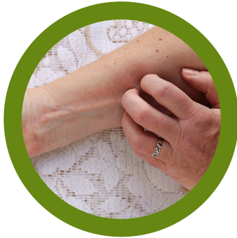
debajo de los brazos