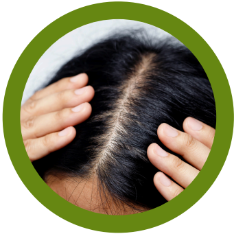
Dentro y alrededor del cabello