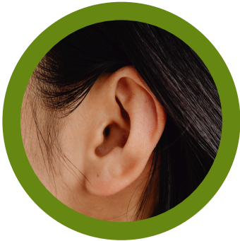
Dentro y alrededor de los oídos