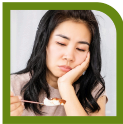
Falta de apetito