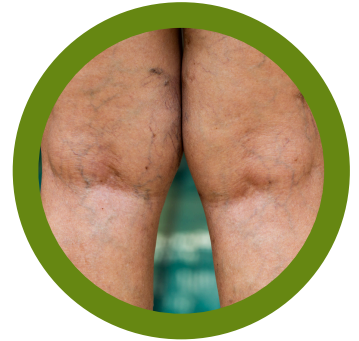
Detrás de las rodillas